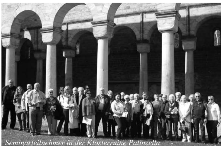
Seminarteilnehmer in der Klostersruine Palinzella

29 Männer und Frauen aus dem Rheinland, Emsland, Schwarzwald, Tauberland, aus Westfalen und Franken waren zum Seminar „Kirchen und Klöster in Thüringen ...“ angereist und im Bischöflichen Bildungshaus St. Ursula untergebracht. Das Programm ist in RENOVATIO 3/4 2008 nachzulesen. Die Einführung befasste sich mit der Gründung des Bistums Erfurt durch Bonifatius, der Darstellung von Mönchs- und Bettelorden, auch der Beginnen, alle mit großen Anlagen und Kirchen aus der Übergangszeit von Romanik zur Gotik vertreten. 30 Kirchen sollen es gewesen sein. Der erforderliche Reichtum resultiert aus Anbau, Handel und Verarbeitung von Waid. Aus seinen Blättern wird ein Indigo-farbstoff gewonnen, der erst am „blauen Montag“ Farbe bekennt.